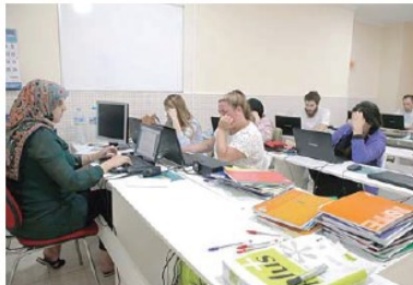
Los estudiantes se preparan en diferentes aulas adaptadas

“En la parte teórica, los estudiantes aprenderán qué usar para encontrar empleo