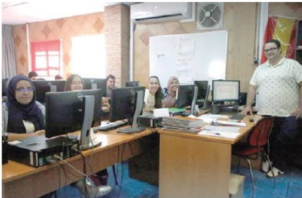
En imágenes, los alumnos del curso de preparación al mundo laboral, en las diferentes aulas de la academia, trabajando diversas aptitudes, como ofimática

“Los estudiantes tienen una formación teórica, de 120 horas, mes y medio, y una práctica, de 6 meses de duración”