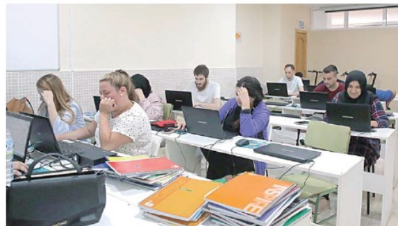
Los alumnos que se preparan suelen mostrarse “satisfechos” con las aptitudes recibidas

Durante esta formación se les explica una variedad de temas muy transversales sobre herramientas que pueden utilizar para una búsqueda de empleo, como ofimática, inglés empresarial, uso de las herramientas aportadas