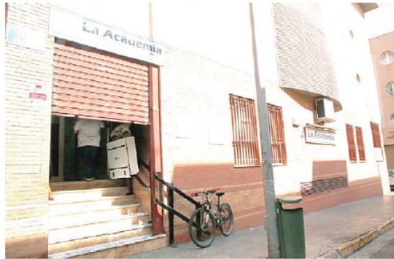
Seriform ofrece desde hace más de 5 años diferentes cursos subvencionados por FSE y Promesa