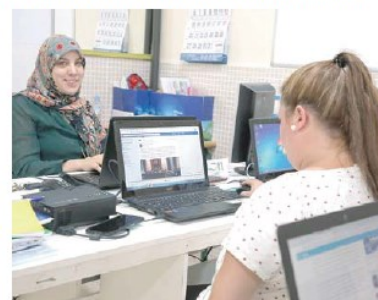
Los estudiantes, además de teoría, realizan prácticas laborales

Alacis aclara que “los alumnos participantes en alguno de los dos cursos realizarían la parte práctica en una entidad empresarial que esté relacionada con sus estudios, es decir, si el joven que ha decidido llevar a cabo esta formación, anteriormente se ha estado preparando para traba-