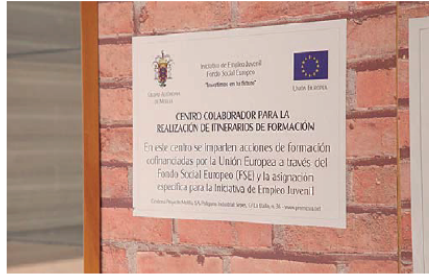
La academia melillense, Seriform, lleva en el mundo de la formación de jóvenes más de cinco años, y ofrece cursos de PROMESA y FSE