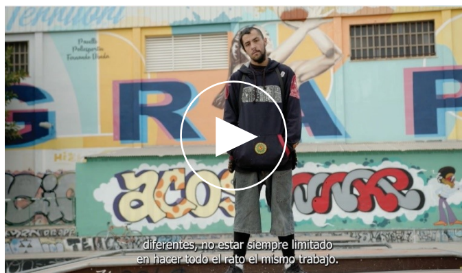
Vídeo recopilatorio de entidades beneficiarias