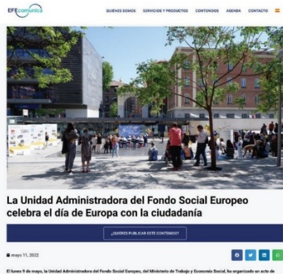
Nota de prensa en EFE