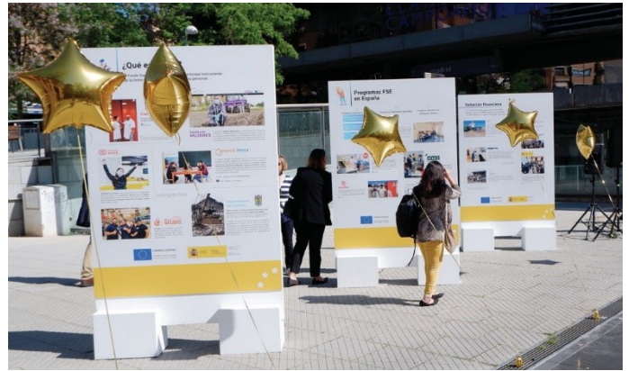
Exposición fotográfica paneles 1,5 x 2 mts.