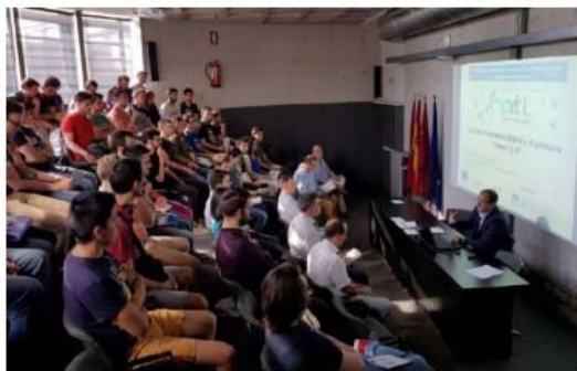
Aplicaciones de Tecnología 4.0 al Sector Industrial: La Realidad de la Industria 4.0, CEEIC, Murcia.