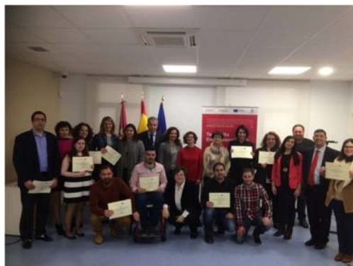
Clausura Team Mix Madridejos, Cámara de Comercio de Toledo, Castilla La Mancha.