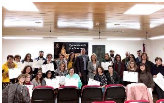
Clausura San Clemente, Autoempleo y Consolidación, Fundación INCYDE, Castilla la Mancha