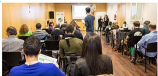
Jornada Conecta Circular (Programa con emprendedores) en Barcelona