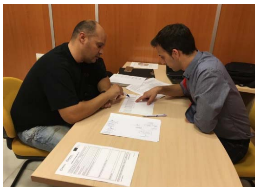
Formación individual, Cámara de Comercio de Almería, Andalucía.