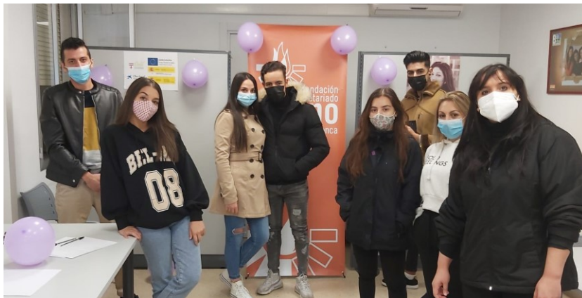
Actividad de sensibilización sobre prevención de la violencia de género, Cuenca

Además, se han realizado 242 acciones de sensibilización para promover la igualdad de género en la comunidad gitana: 162 sobre promoción de la igualdad, la conciliación y la corresponsabilidad y 80 sobre prevención de la violencia de género, participando en ellas un total de 1.683 personas gitanas (1.123 mujeres y 560 hombres). Algunas de estas actividades se realizaron en el marco del 8 de marzo Día Internacional de las Mujeres, o del 25 de noviembre Día Internacional contra la Violencia de Género: