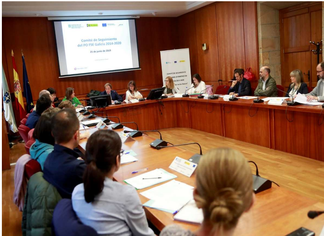
Fotos del Comité de Seguimiento 21-06-2019