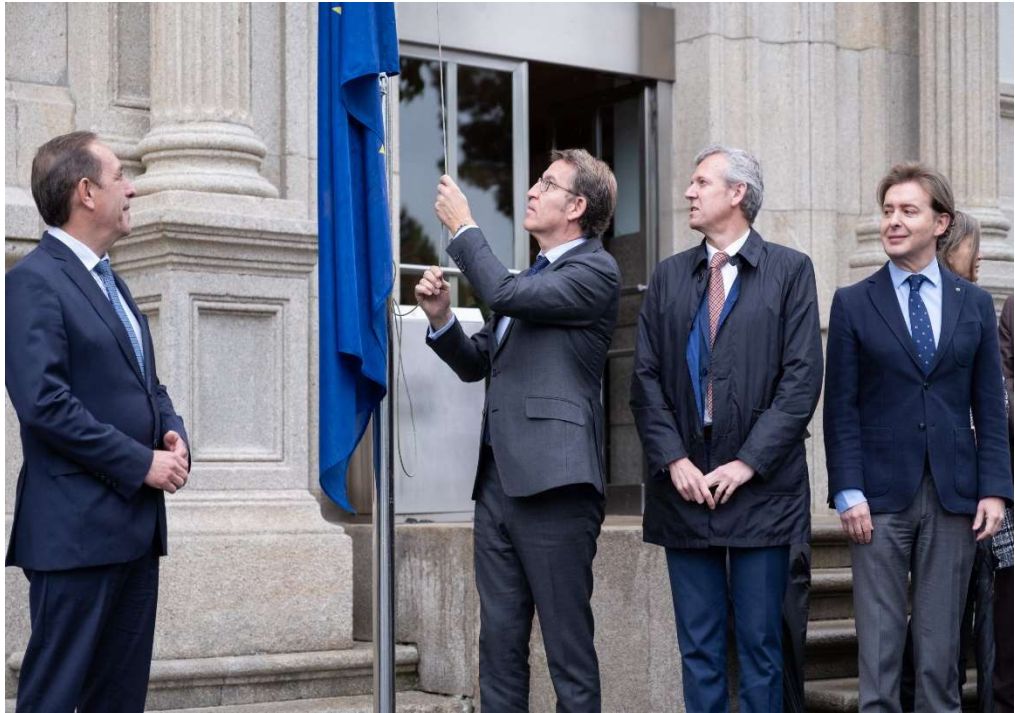
Día de Europa 09-05-2019