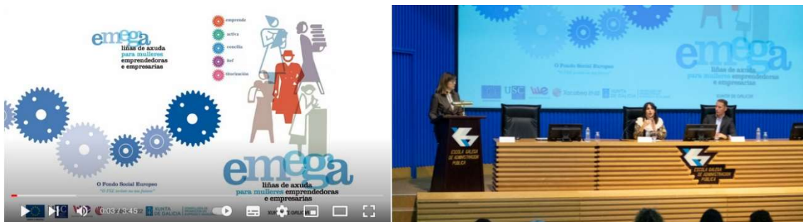
V ENCONTRO EMPREENDEDORAS PROGRAMA EMEGA: emprendedora

Se han realizado actos para presentar y divulgar las actuaciones realizadas. En esta línea, el 12 de diciembre tuvo lugar el V Encuentro de emprendedoras del programa Emega, en un acto que contó con la presencia de la Conselleira de Promoción del Empleo e Igualdad y donde las emprendedoras Emega dieron visibilidad a las empresas creadas poniendo en valor la cofinanciación del Fondo Social Europeo. Se han publicado los vídeos de la inauguración ( https://www.youtube.com/watch?v=V4hv1I2QJFI ), así como de las distintas entrevistas realizadas a las emprendedoras en la feria expositiva ( https://www.youtube.com/watch?v=KHMJDV8-XbM ) y la clausura del acto ( https://www.youtube.com/watch?v=0ZxdnL-_NtY ).