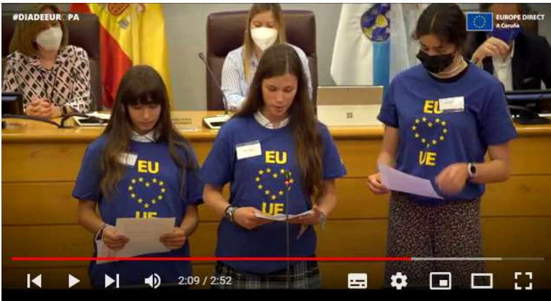
A Europa que queremos - Celebración Día de Europa