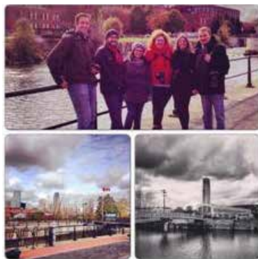
Salida fotográfica Canal-Lachine.

Desde hace varios meses tenemos una sección llamada Trad’iciones. En ella se encuentran aquellas salidas, actividades o reuniones que descubren a los españoles residentes en Montreal la vida y las costumbres de Québec. Salidas por los barrios, actividades relacionadas con las tradiciones montrealenses, etc. Es una forma divertida y amena de conocer el país al que hemos decidido venir a vivir y una manera de integrarnos en la ciudad. El grupo ha crecido también muchísimo en el campo de las actividades y las salidas en grupo. Aprovechando la enorme oferta cultural de Montreal, programamos visitas, salidas a exposiciones (como por ejemplo el día de las jornadas de los museos), paseos, salidas fotográficas, y además organizamos exposiciones de fotografía, concursos de relatos, etc. Todo para hacer que la comunidad española crezca en cultura. Que se mueva. Y hacerla más visible dentro del panorama cultural de la ciudad. LA CULTURAL DE MONTREAL es, desde el principio, un punto de encuentro inquieto y divertido que pretende mirar la diversidad de Montreal desde la perspectiva de la cultura que nos ha visto nacer.