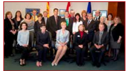
Directores de las escuelas públicas y católicas de Edmonton y de las escuelas públicas de Red Deer en la ceremonia de Edmonton del 9 de mayo.