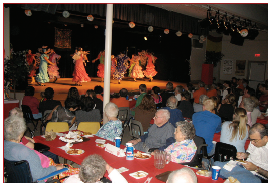
Foto: Actuación española en una edición de Folklorama