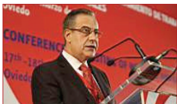
Foto: el ministro Celestino Corbacho en la conferencia celebrada en Oviedo.