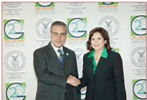
Foto: Celestino Corbacho e Hilda Solís, secretaria de Trabajo de EE. UU.

Los ministros de Trabajo de los países del G-20, entre ellos el español D. Celestino Corbacho , se reunieron del 19 al 21 de abril en Washington para consensuar una serie de recomendaciones para ser tratadas en la cumbre del G-20 de finales de junio en Toronto. Las recomendaciones son: acelerar la creación de empleo y asegurar una recuperación sostenible y el futuro crecimiento; reforzar los sistemas de protección social y promover políticas activas de mercado de trabajo inclusivas; situar la calidad del empleo y la paliación de la pobreza en el centro de las estrategias económicas nacionales y globales; mejorar la calidad del empleo para nuestros ciudadanos, y preparar a la población activa para los futuros retos y oportunidades. Estas recomendaciones fueron adelantadas por los ministros al presidente Obama.