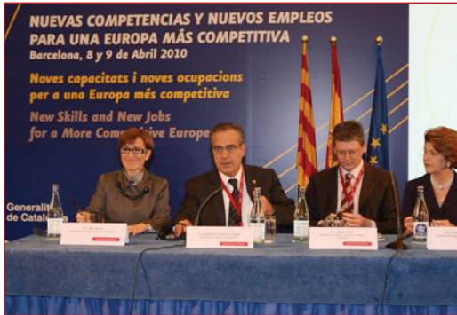
Foto de la conferencia "Nuevas competencias y nuevos empleos para una Europa más competitiva".

Según informa el GC, a la conferencia asistieron, además de expertos en materia de empleo, representantes de los Estados Miembros (EE. MM.) de la UE, de comunidades autónomas, y de agentes sociales y económicos. Se trató de los empleos con más futuro en los próximos años y de las capacidades que deberán tener los trabajadores europeos del siglo XXI. El ministro D. Celestino Corbacho explicó que las capacidades para la ocupación son uno de los retos de la "Estrategia UE 2020", y añadió que la conferencia debería servir para diseñar una línea de acción para "mejorar" la capacitación ante los retos que plantean las futuras necesidades de cualificación de la UE. La comisaria europea de Educación, D a Androulla Vassiliou , explicó que, para 2020, se habrá pasado del 29% al 35% de empleos que requieren alta cualificación, al tiempo que el actual 20,8% de empleos de baja cualificación se habrá reducido al 15%. Para el comisario europeo de Empleo, D. László Andor , hay que "casar mejor" las capacidades con las necesidades del mercado laboral para convertir a la UE en la región "más competitiva del mundo". Finalmente, la consejera de Trabajo de la Generalitat de Cataluña, D a . Mar Serna , recordó que el objetivo de la UE es llegar en 2020 al 75% de ocupación en la población entre 20 y 64 años, y se mostró partidaria de aprovechar el "talento y el conocimiento" de todos, en especial de jóvenes y mujeres.