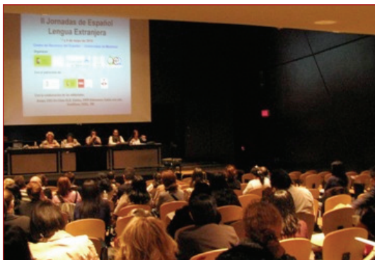
Foto: Un momento de la mesa redonda en las Jornadas de Montreal.

El Primer Encuentro de Profesores de Español de Alberta se celebró en el Centro de Recursos del Español en Edmonton los días 14 y 15 de mayo de 2010 y contó con 62 participantes, que se distribuyeron entre 9 talleres didácticos y una sesión plenaria. El encuentro se realizó con la colaboración del Consulado General de España en Toronto, el Edmonton Regional Learning Consortium , la Oficina de Turismo de España en Toronto, la Consejería Económica y Comercial de la Embajada de España y el ICEX. Participaron además tres editoriales españolas y un distribuidor canadiense. El Centro de Recursos del Español en Edmonton pone todos sus recursos a disposición de los profesores de español de la provincia de Alberta.