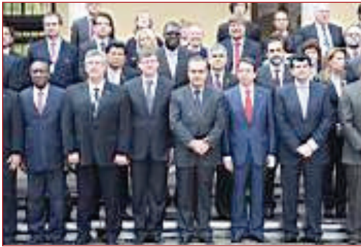
Foto de familia de los ministros de Seguridad Social UE-LAC en Alcalá de Henares

a la participación de los EE. MM. de la UE en el Convenio Multilateral Iberoamericano de Seguridad Social". El señor Granado concluyó que "los derechos de los trabajadores deben circular de un extremo a otro del mundo, como lo hacen las personas, las mercancías y los capitales".