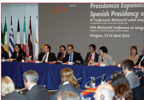
Foto de la "IV Conferencia Ministerial Europea sobre Integración" celebrada en Zaragoza.