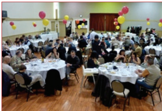
Foto de la fiesta de marzo de 2010 de la Sociedad Española en la British Columbia, cedida por ésta.

La Sociedad Española de la British Columbia ( delafuente.carmen@gmail.com ) se complace en anunciar el lanzamiento de su nuevo programa piloto para la enseñanza de la lengua y de la cultura española a las nuevas generaciones y miembros más jóvenes de la asociación. El curso está pensado para facilitar la inmersión lingüística a niños y niñas, a través de una metodología lúdica. Los contenidos se han organizado por temas, en los que se trabajan situaciones comunicativas básicas que introducen la lengua a los más pequeños. Los temas se agrupan, a su vez, en cuatro módulos subdivididos por edades de 0 a 10 años. Las clases se imparten los sábados por la mañana en el Centro Croata de Vancouver, y están abiertas a todos los hijos y nietos de los miembros de la asociación. El objetivo de este proyecto gratuito es que las nuevas generaciones de españoles en British Columbia "cultiven y desarrollen la cultura española de forma práctica", creando así las bases para una evolución progresiva y consistente de la asociación, así como para la divulgación de la cultura española en British Columbia. Asimismo,