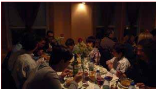
Foto: Fiesta del Socio en el Centro Gallego de Montreal.

Estamos en diciembre; un año más, la oleada de fiestas y celebraciones llega puntual a los centros y asociaciones de españoles en Canadá. De este a oeste las fiestas decembrinas serán como siempre uno de los momentos álgidos de reunión de la comunidad española que agrupada en los clubes, recibirá al Olentzero, conjurará a las meigas, contará las uvas y esperará unida la visita de los Reyes Magos. Por unos días, la calle St. Laurent de Montreal olerá a churros y chocolate, se montará el Belén en Toronto, sonarán panderetas en Winnipeg y en Vancouver no habrá lluvia que apague la fiesta. Si se anima, aquí les señalamos algunos de los eventos festivos de la comunidad española en Canadá.