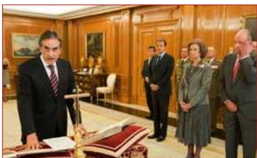
Foto: Toma de posesión de D. Valeriano Gómez Sánchez.

Por Real Decreto 1325/2010, de 20 de octubre, D. Valeriano Gómez Sánchez ha sido nombrado nuevo ministro de Trabajo e Inmigración, en sustitución de D. Celestino Corbacho Chaves , quien ha dejado su puesto para reforzar, como número tres, las listas del PSC para las elecciones catalanas del 28 de noviembre. El nuevo ministro, jiennense de Arroyo del Ojanco, nació en 1957 y ya ha servido a este ministerio como asesor ejecutivo (de 1988 a 1994) y como secretario general de Empleo (de 2004 a 2006). Licenciado en Ciencias Económicas y Empresariales, trabajó como economista en el Gabinete Técnico de la Comisión Ejecutiva Confederal de UGT, y fue administrador único de la cooperativa de viviendas de UGT, PSV, entre 1994 y 2003. También fue director general del Fondo de Promoción de Empleo del Sector Siderúrgico Integral entre 1986 y 1987. Ha dirigido el Seminario de Empleo del Instituto Universitario de Investigación José Ortega y Gasset y ha sido consejero del Consejo Económico y Social.