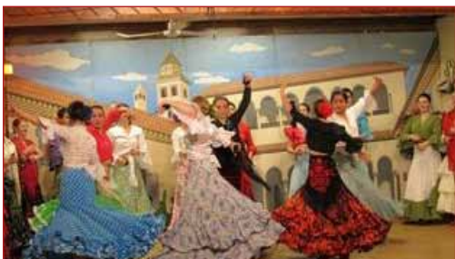
Foto: Día de las Tapas en el Club español de Winnipeg.

En Toronto , en el Club Hispano, tras la fiesta hispana de septiembre y la de San Martiño, que se celebró el pasado 20 de noviembre, las meigas se baten en retirada para dar paso a las celebraciones navideñas. El 17 de diciembre a las 17 horas, se abrirá el Belén. El famoso Belén del Club Hispano de Toronto estará expuesto una vez más para todos sus socios y su apertura se realizará durante una cena ambientada con tradicionales villancicos en la que, además, se efectuará también la venta de productos típicos navideños. La fiesta de Nochevieja comenzará a las 19:30 del 31 de diciembre. Incluirá una suculenta cena de gourmet, servida por el chef Keith Patrick, con uvas y cotillón.