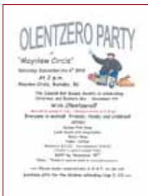
Foto: Cartel de la Fiesta del Olentzero de la Sociedad Vasca de Vancouver.

En Vancouver , la Sociedad Española de British Columbia celebrará el 11 de diciembre, a las 19 horas, la fiesta familiar de Navidad en el Croatian Centre (3250 Commercial Drive). El 8 de enero, se celebrará la visita de sus Majestades los Reyes Magos de Oriente; merienda gratis y sorpresas para los niños. Y la Sociedad Vasca de Vancouver celebrará el día 4 de diciembre la Navidad y el Día del euskera, en una fiesta a la que tiene previsto asistir el Olentzero cargado de juguetes para los niños.