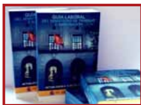
Foto: Ejemplares de la nueva Guía Laboral.

El BOE ( www.boe.es/boe/dias/2011/11/26/pdfs/BOE-A-2011-18598.pdf ) publica el Real Decreto 1710/2011, de 18 de noviembre, por el que se modifica el Real Decreto 240/2007, de 16 de febrero, sobre entrada, libre circulación y residencia en España de ciudadanos de la Unión Europea y de otros Estados parte en el Acuerdo sobre el Espacio Económico Europeo, en orden a reforzar la conexión de la interpretación de éste con el de la Directiva 2004/38/CE, relativa al derecho de los ciudadanos de la Unión y de los miembros de sus familias a circular y residir libremente en el territorio de los Estados miembros , así como con los criterios establecidos por el Tribunal Supremo en su sentencia de 1 de junio de 2010, que anuló diversos apartados de artículos de aquél.