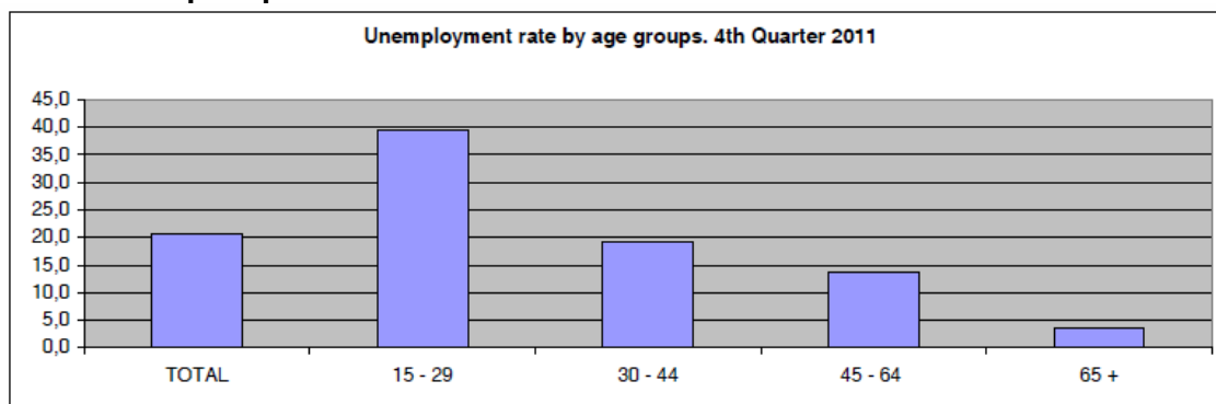
Tasa de desempleo por tramos de edad. 4º trimestre de 2011

Por tramos de edad, el de jóvenes entre 15 y 29 años es el que presenta la mayor tasa de desempleo (39,5% en general y 44,9% para las mujeres).