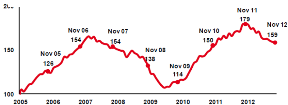
Índice de vacantes de la Agencia Federal de Empleo (BA-X) Noviembre 2012 2005-2012