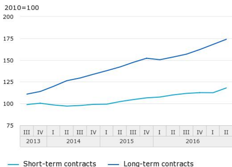
Hours worked in temp jobs, seasonally adjusted

Según la Oficina Central de Estadísticas de Holanda CBS, la facturación generada por las agencias temporales, las agencias de empleo y las compañías de nómina payroll creció un 2,0 por ciento en el segundo trimestre de 2017 en relación con el primer trimestre de este año. El crecimiento es mayor que en el trimestre anterior. El número total de horas temporales aumentó un 4,2 por ciento, el mayor incremento desde el segundo trimestre de 2007.