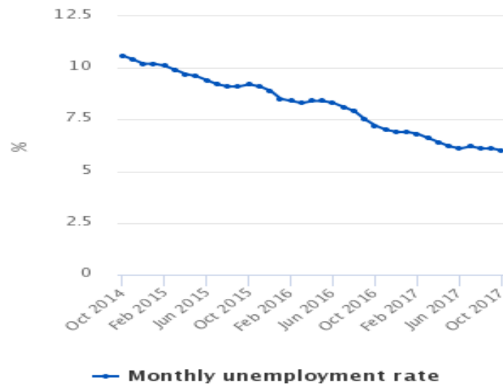
Figure 1 Monthly unemployment rate (ILO), October 2014 to October 2017