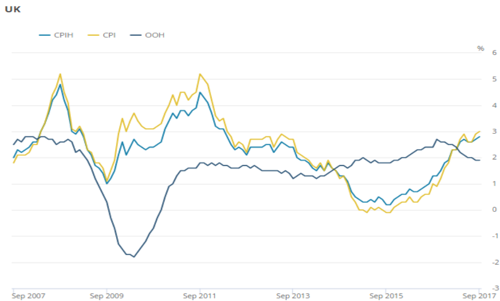
Figure 1: CPIH, OOH component and CPI 12-month rates for the last 10 years: September 2007 to September 2017