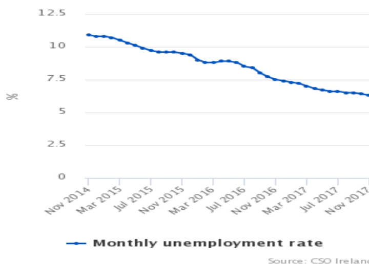
Figure 1 Monthly unemployment rate (ILO), November 2014 to November 2017

La tasa de desempleo en noviembre se ha reducido en una décima, situándose en el 6,1%, 2 décimas menos que en octubre 2017 1,2 puntos por debajo de lo registrado en noviembre de 2016. En este gráfico puede verse la evolución de la misma desde el año 2014: