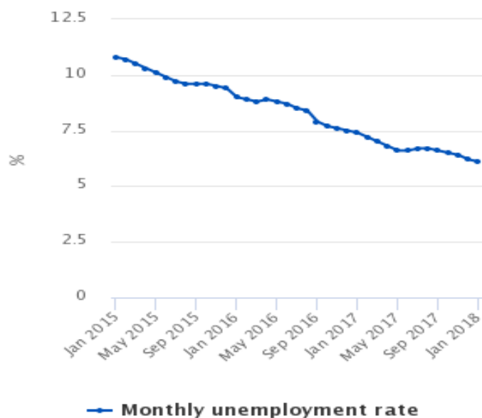
Figure 1 Monthly unemployment rate (ILO), January 2015 to January 2018