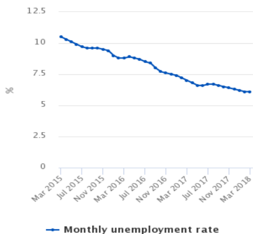
Figure 1 Monthly unemployment rate (ILO), March 2015 to March 2018