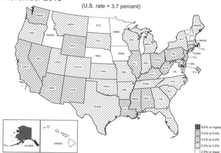
Map 1. Unemployment rates by state, seasonally adjusted, November 2018

En términos interanuales, el empleo ha aumentado en 37 estados y ha permanecido estable en el resto y en el Distrito de Columbia, mientras que la tasa de paro ha descendido en 18 estados y no ha registrado variaciones importantes en los otros 32 y en el Distrito Federal.