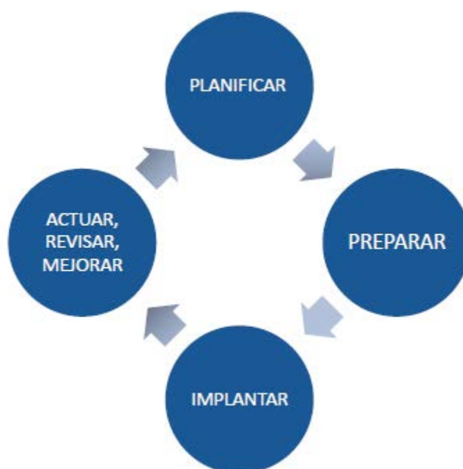
Figura 3: Proceso de compromiso de los grupos de interés

Tras establecer el propósito, el alcance y los grupos de interés para el compromiso, los propietarios del compromiso necesitan asegurar que se implanta un proceso de compromiso de los grupos de interés de calidad. El proceso descrito en la norma AA1000SES (2011) consta de cuatro etapas: Planificar; Preparar; Implementar; y Actuar, Revisar y Mejorar.