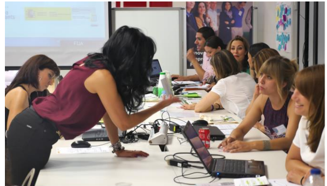
Encuentro transnacional entre las emprendedoras y responsables del ECWT.

Básicamente, consiste en la articulación de un circuito de información y metodologías comunes entre estas entidades,